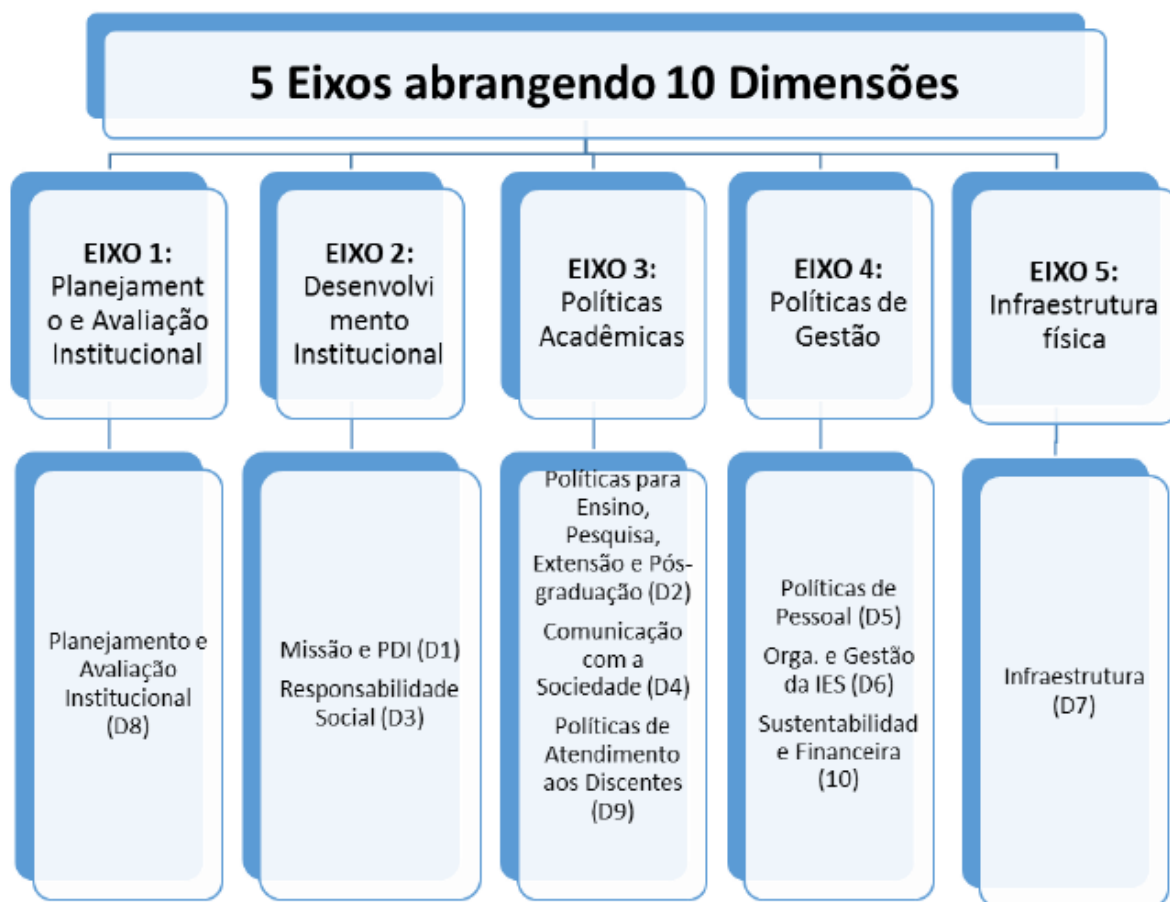
Figura 1: Eixos e Dimensões

No estudo foi apresentada a caracterização da IES, com seu relatório de autoavaliação analisados a partir de cinco eixos que contemplam as dez dimensões do SINAES: